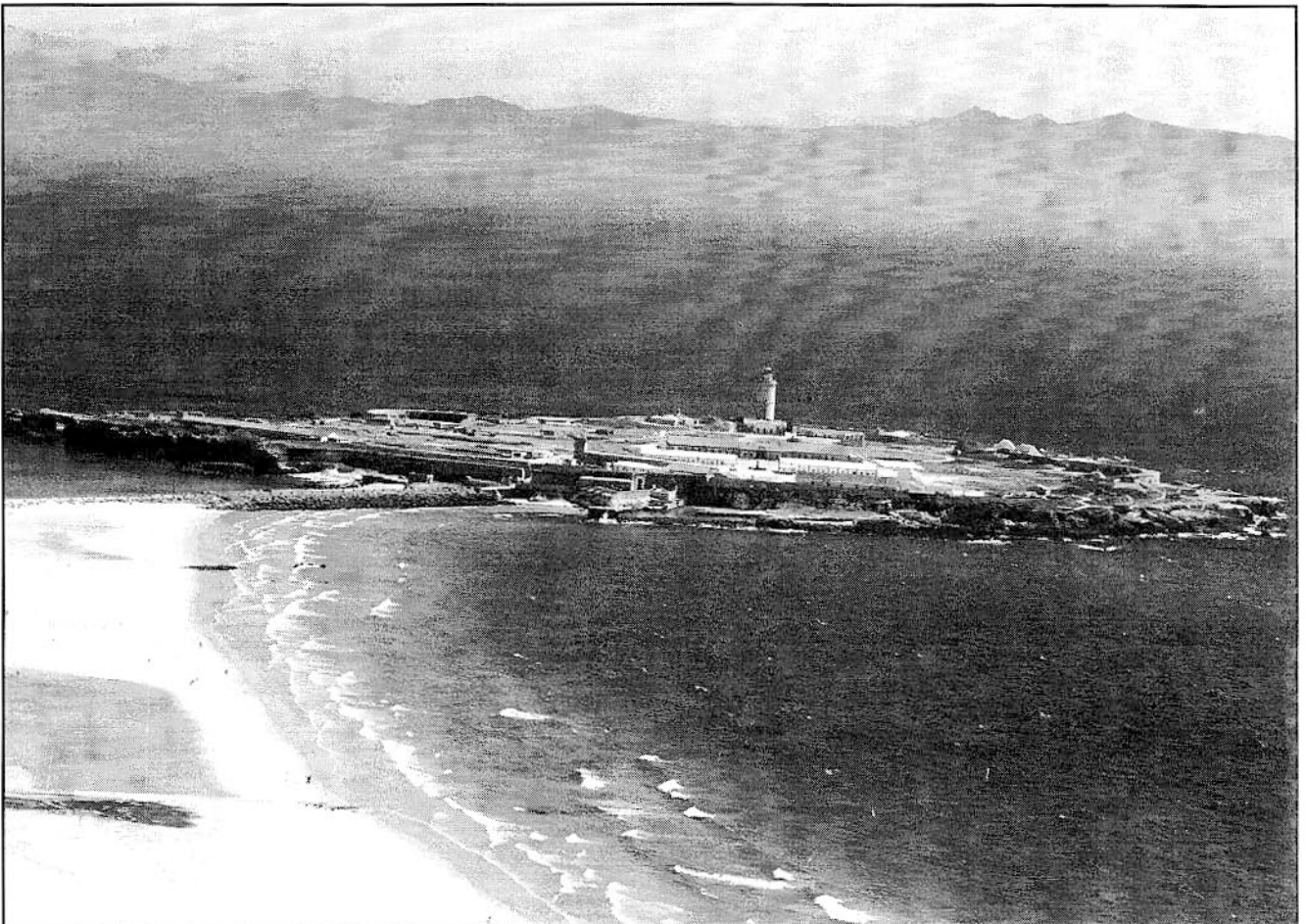
Las playas de Tarifa fueron escenario del desembarco de Tarif en el 710.

El éxito de este ataque, protagonizado por beréberes, animó a los árabes a la realización de una depredación que tuviera mayores dimensiones (2). El rey goda Rodrigo se hallaba en ese momento en el norte de Hispania combatiendo una sublevación de los vascos; al conocer la noticia de la incursión de Tarif, algún tiempo después, decidió reorganizar su ejército y marchar hacia el sur.